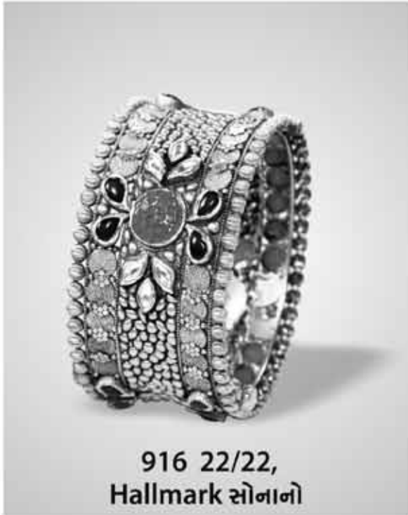
916 22/22, Hallmark સોનાનો