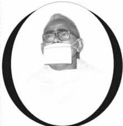
પૂ. નવલ ગુરૂ