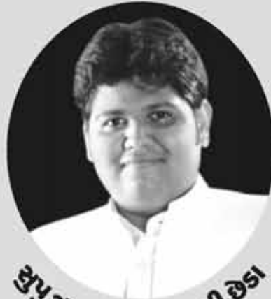
કુપુત્ર : વીરલ લખમશી છેડા